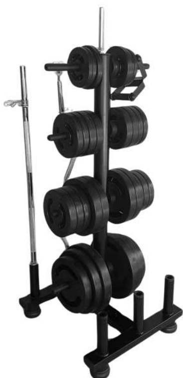
X4SP003 SUPORTE DE ANILHAS E BARRAS