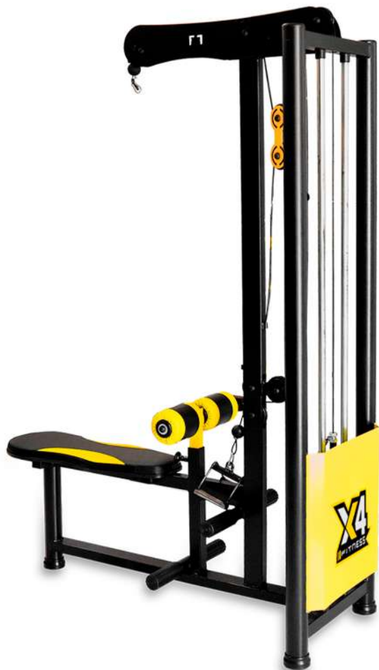
X4MQ025 PUXADOR 2 EM 1