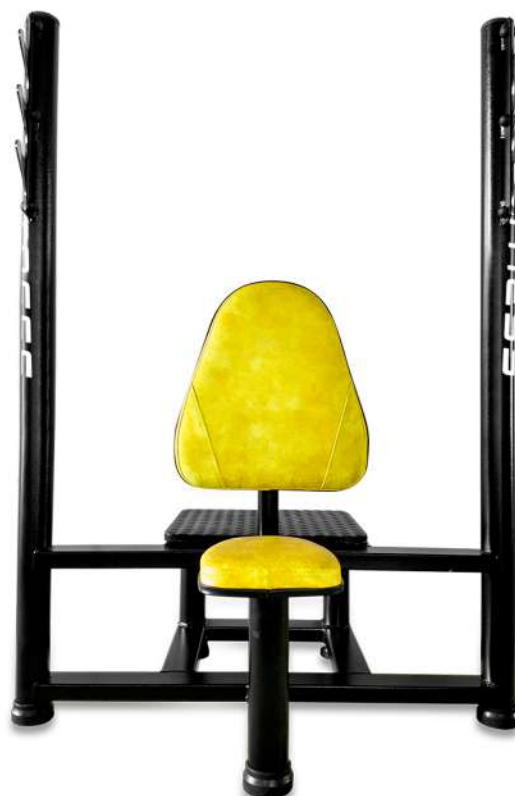
X4BC016 DESENVOLVIMENTO DE OMBROS LIVRE