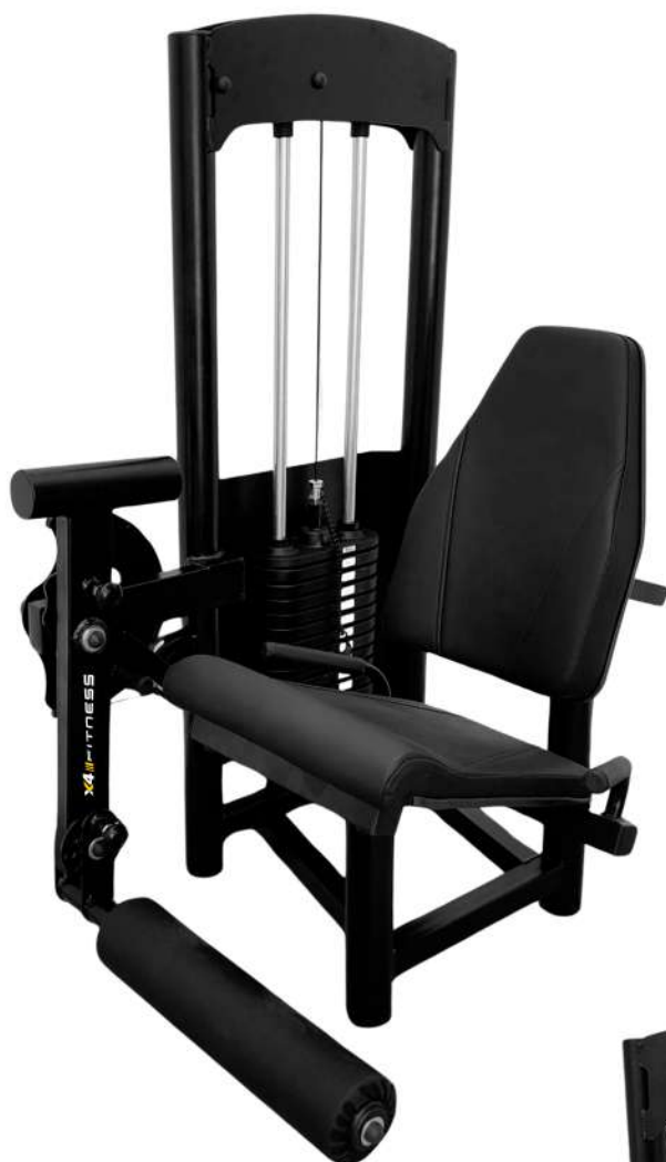
X4MQ009 CADEIRA EXTENSORA