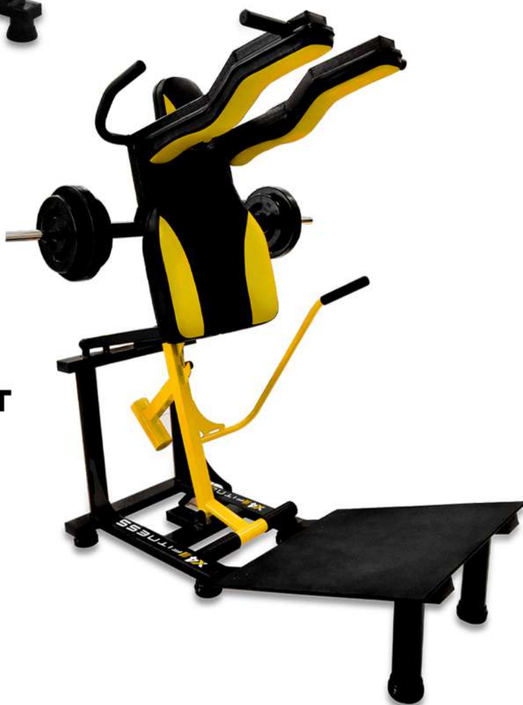
X4PL006 HACK SQUAT