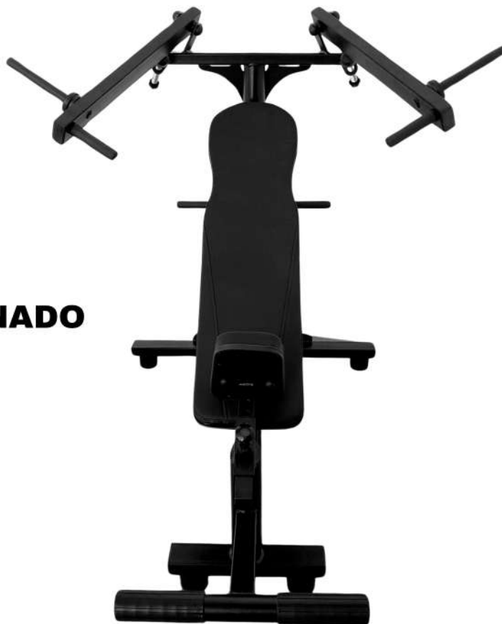
X4AT015 SUPINO INCLINADO ARTICULADO