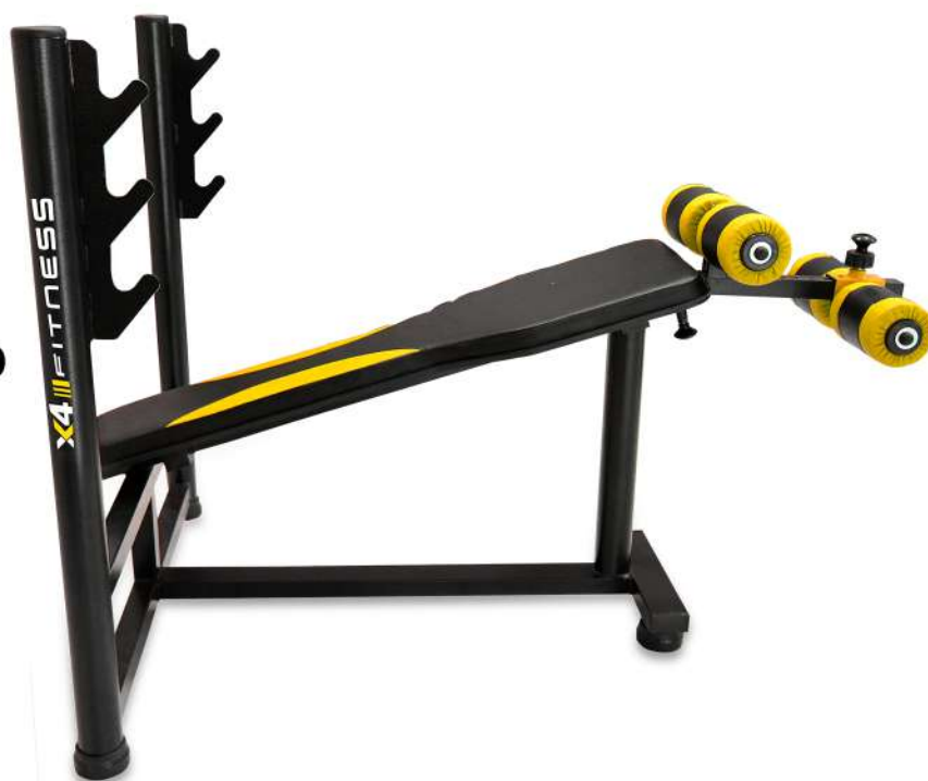
X4BC005 SUPINO DECLINADO