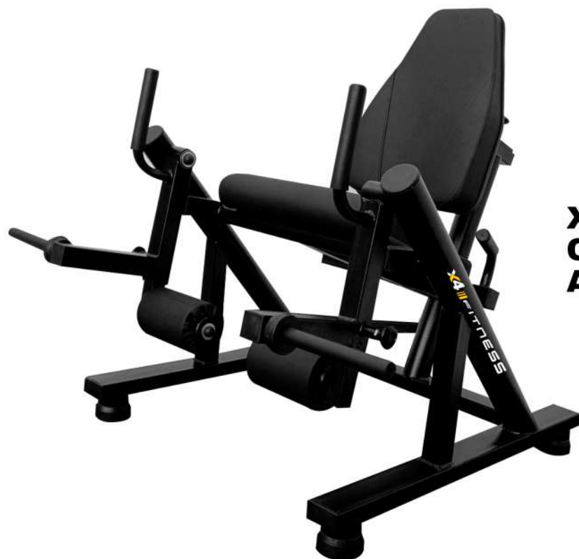
X4AT003 CADEIRA EXTENSORA ARTICULADA