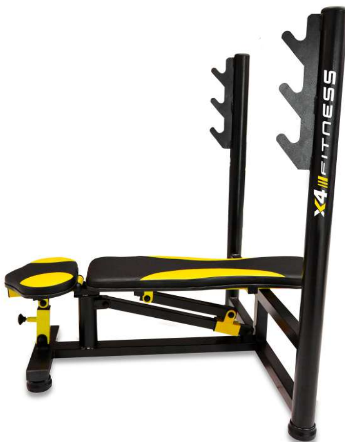
X4BC014 SUPINO 2 EM 1