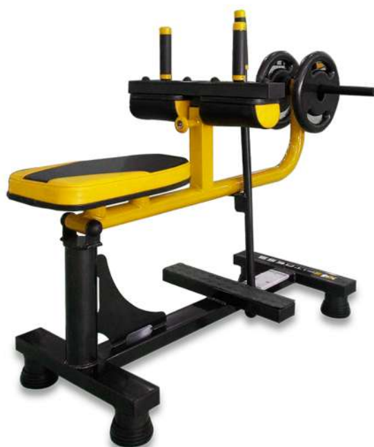
X4PL003 PANTURRILHA SENTADA