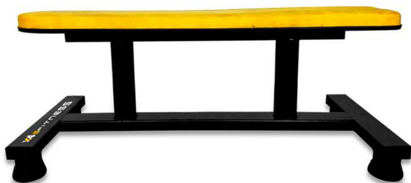
X4BC011 BANQUETA RETA