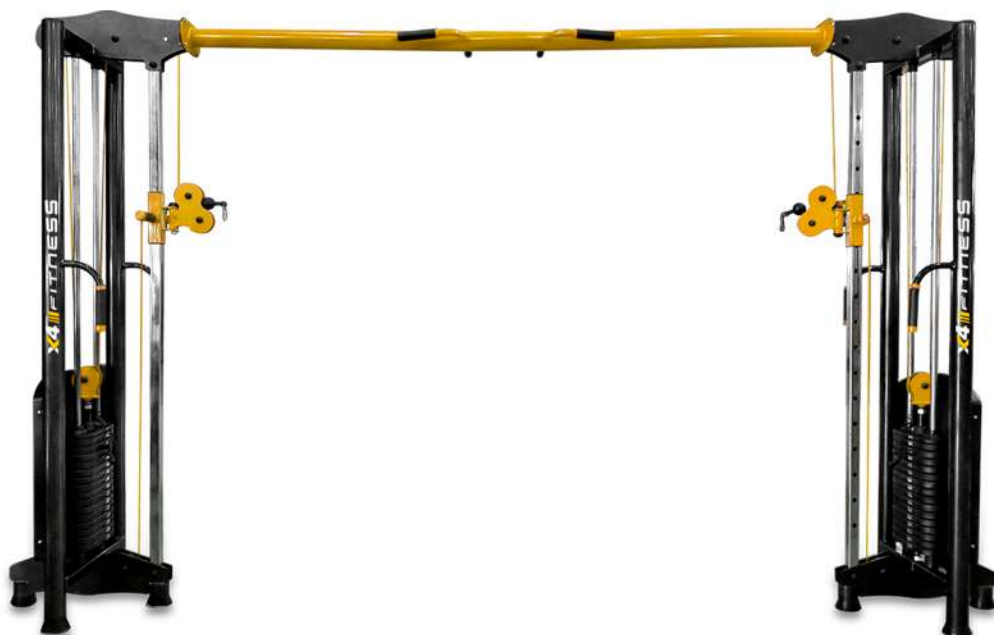
X4MQ007 CROSS OVER