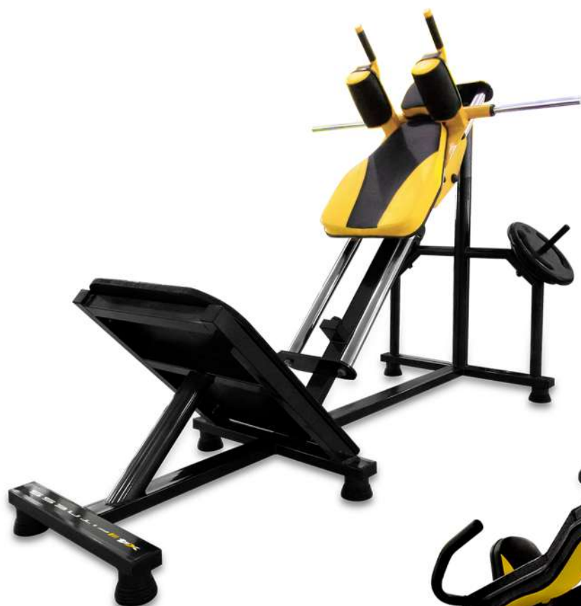
X4PL004 HACK 45