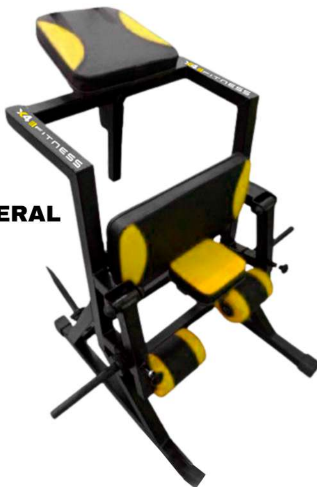
X4AT007 FLEXORA EM PÉ ARTICULADA UNILATERAL