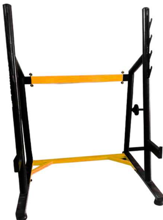
X4SP005 SUPORTE PARA AGACHAMENTO