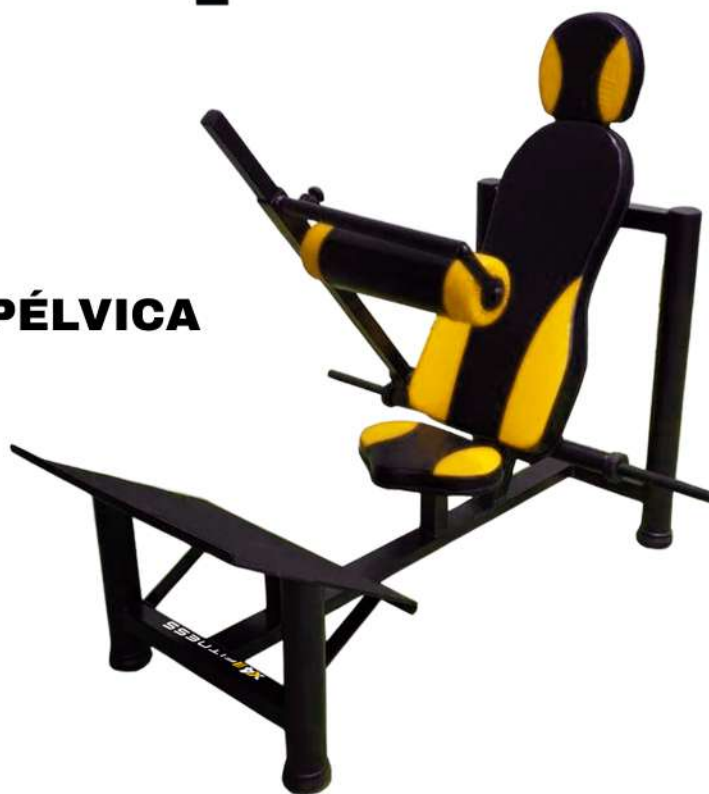
X4PL008 ELEVAÇÃO PÉLVICA