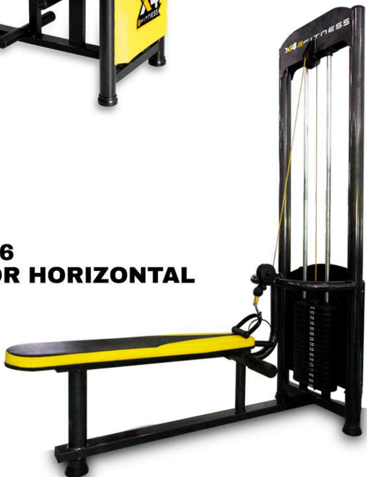
X4MQ026 PUXADOR HORIZONTAL