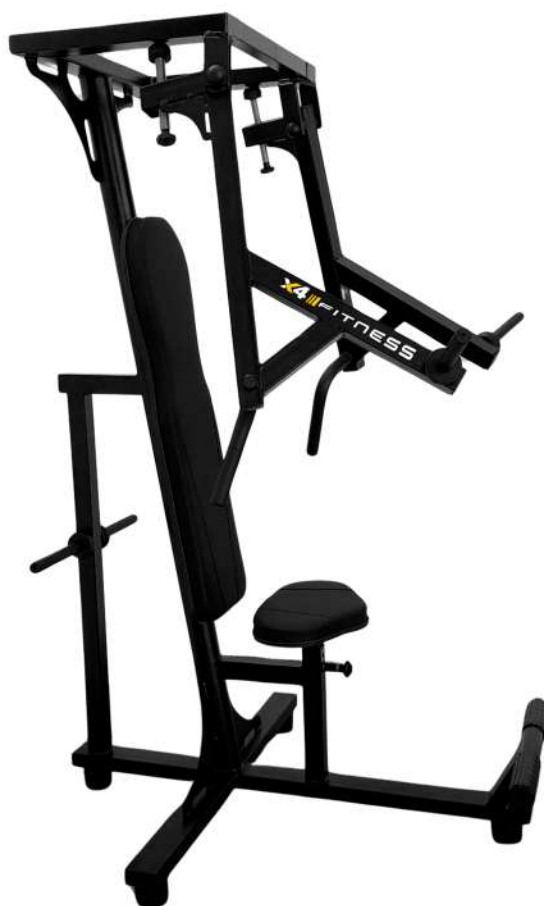
X4AT009 PECK FLY ARTICULADO