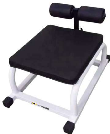
X4BC002 BANCO NORDICO