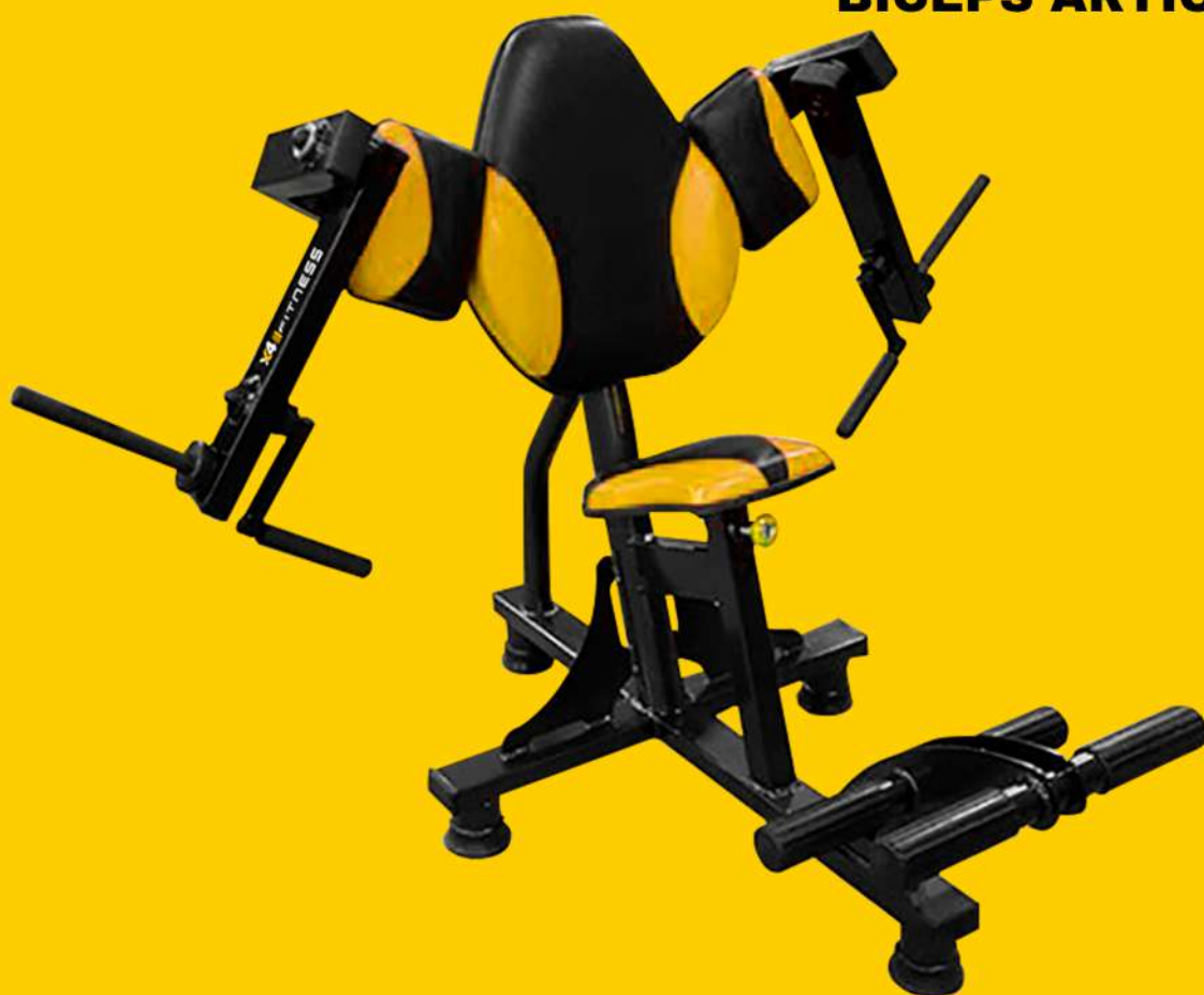
X4AT001 BICEPS ARTICULADO