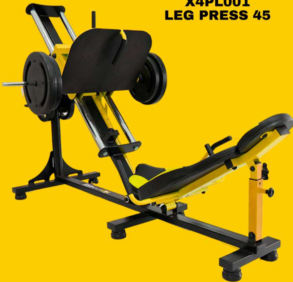
X4PL001 LEG PRESS 45