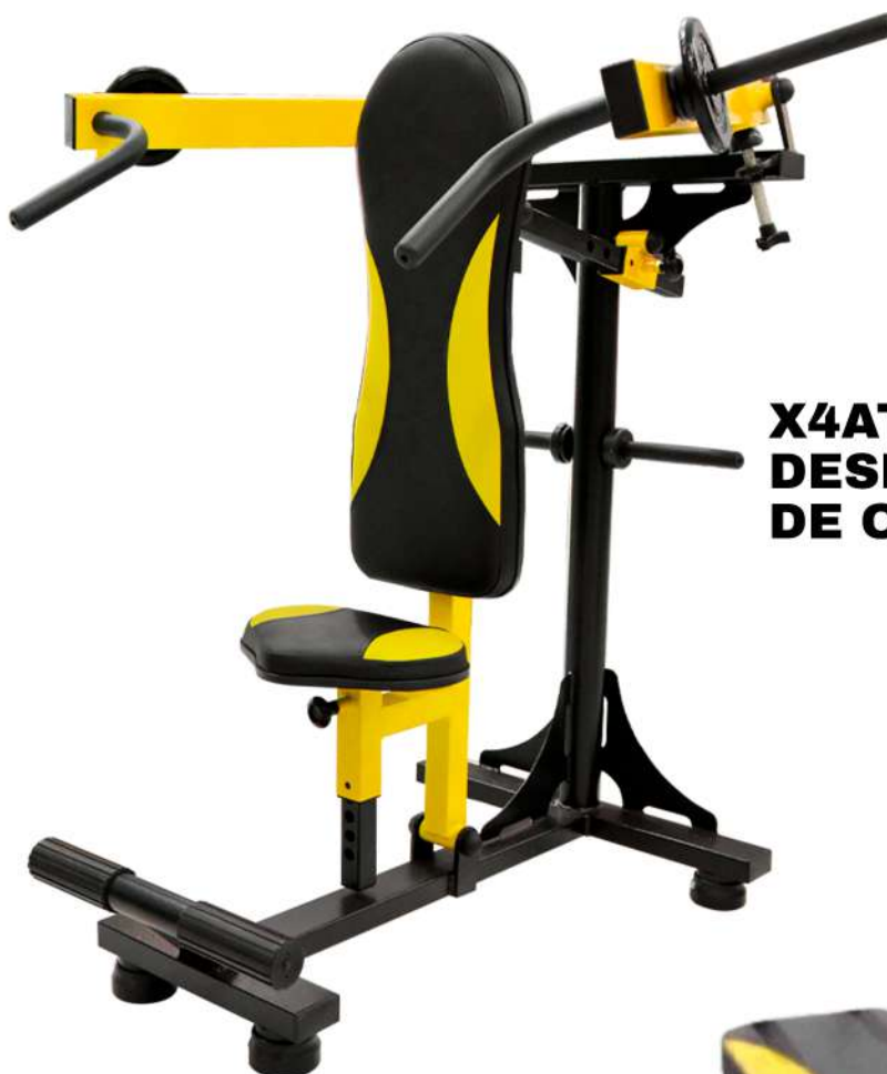
X4AT005 DESENVOLVIMENTO DE OMBRO ARTICULADO