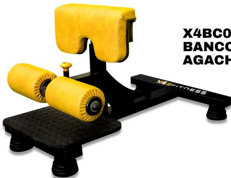
X4BC004 BANCO SISSY AGACHAMENTO