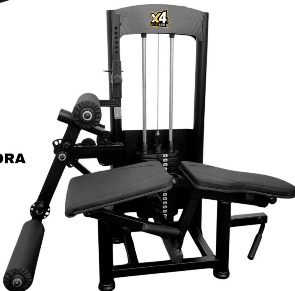
X4MQ019 MESA FLEXORA 3X1