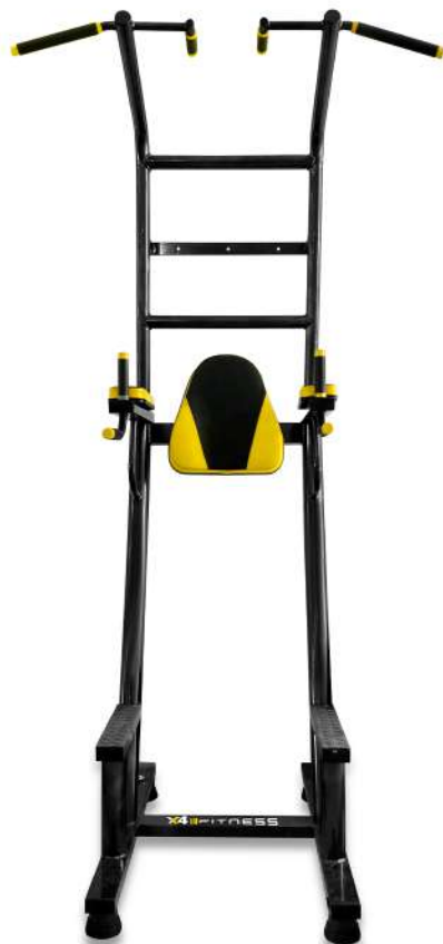
X4BC015 PARALELA PARA ABDOMINAL