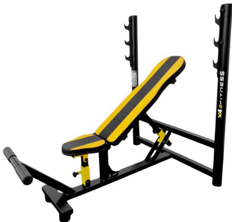
X4BC008 BANCO SUPINO RETO-INCLINADO PARA BARRA