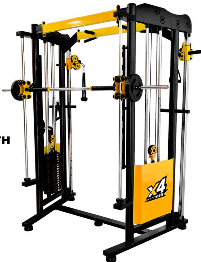
X4MQ008 CROSS SMITH