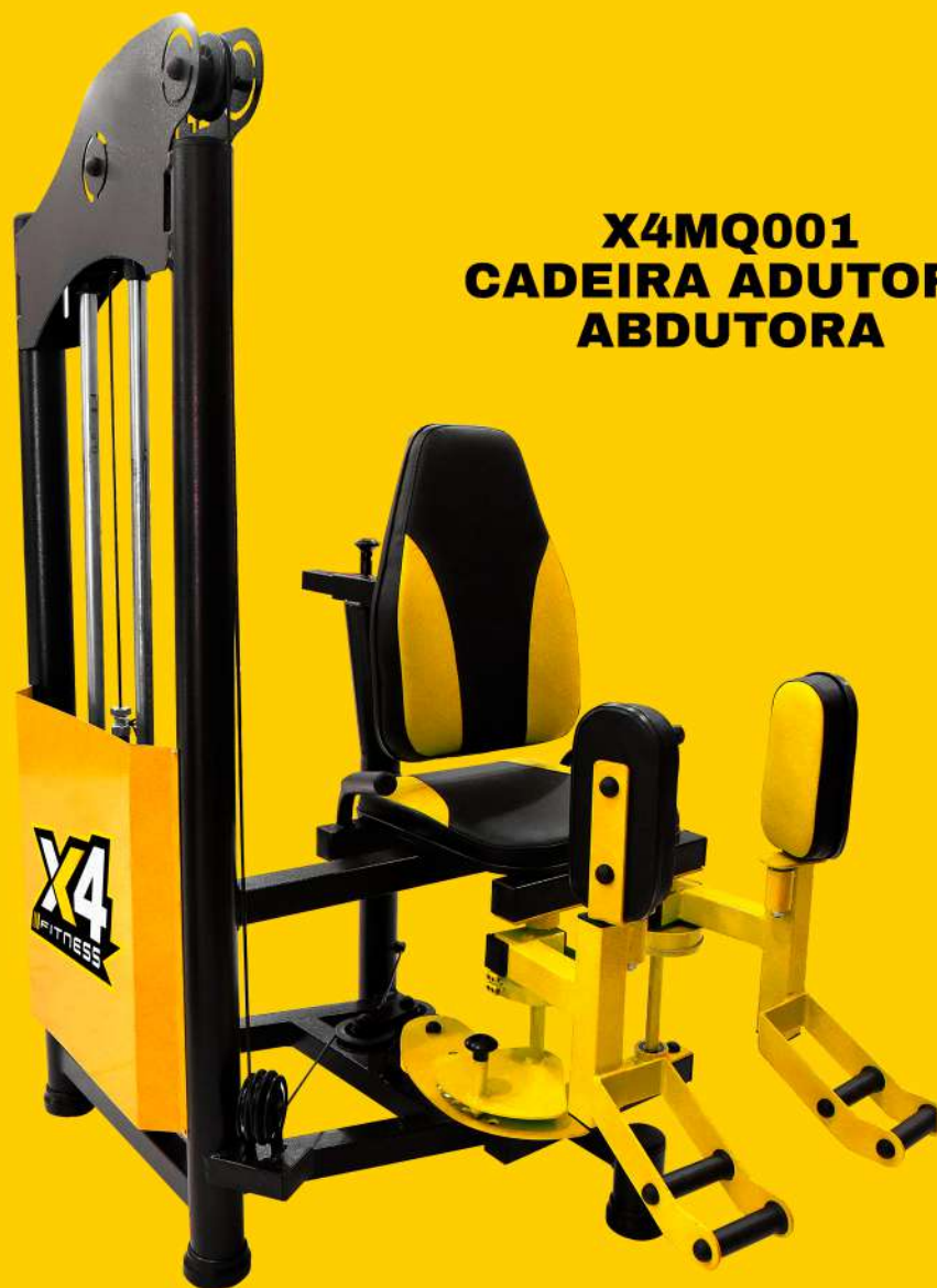
X4MQ001 CADEIRA ADUTORA ABDUTORA