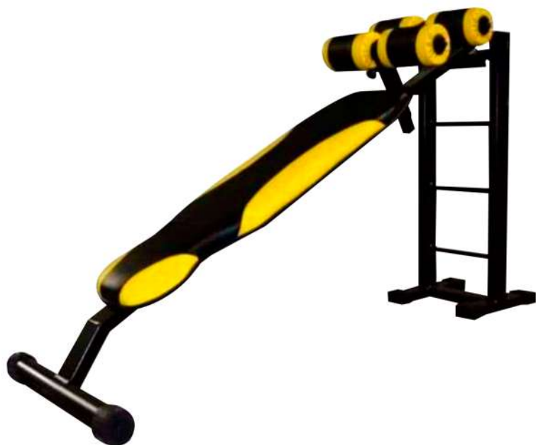
X4BC013 PRANCHA PARA ABDOMINAL