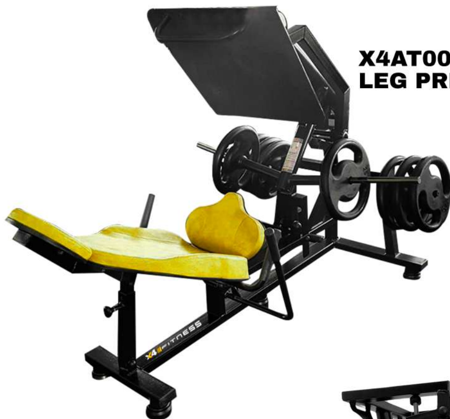
X4AT008 LEG PRESS ARTICULADO