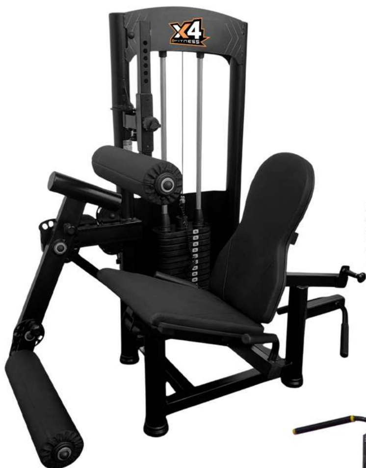
X4MQ013 CADEIRA EXTENSORA FLEXORA