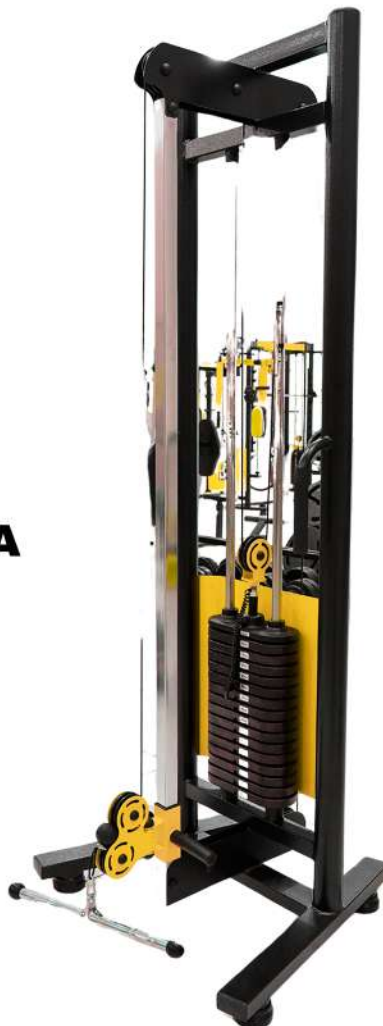
X4MQ024 POLIA UNICA