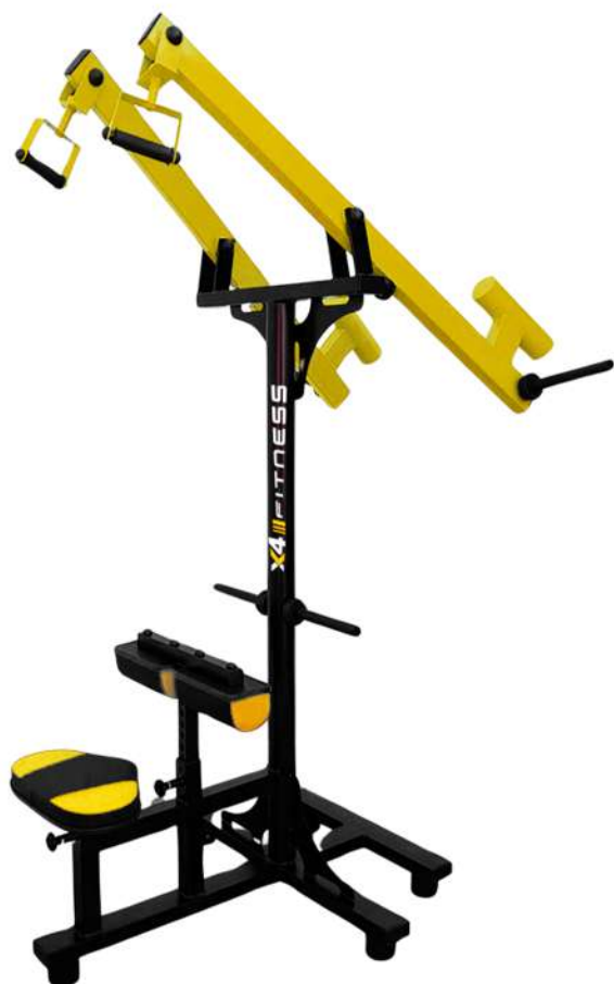
X4AT010 PUXADA ALTA ARTICULADA