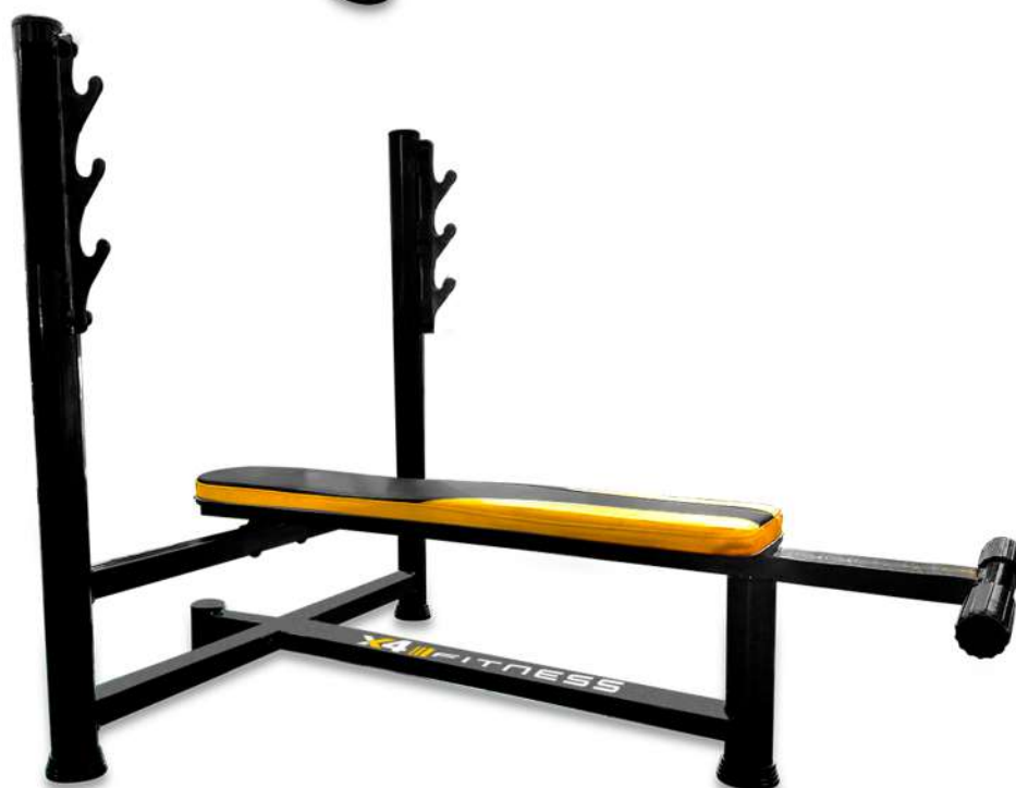
X4BC007 BANCO SUPINO RETO PARA BARRA