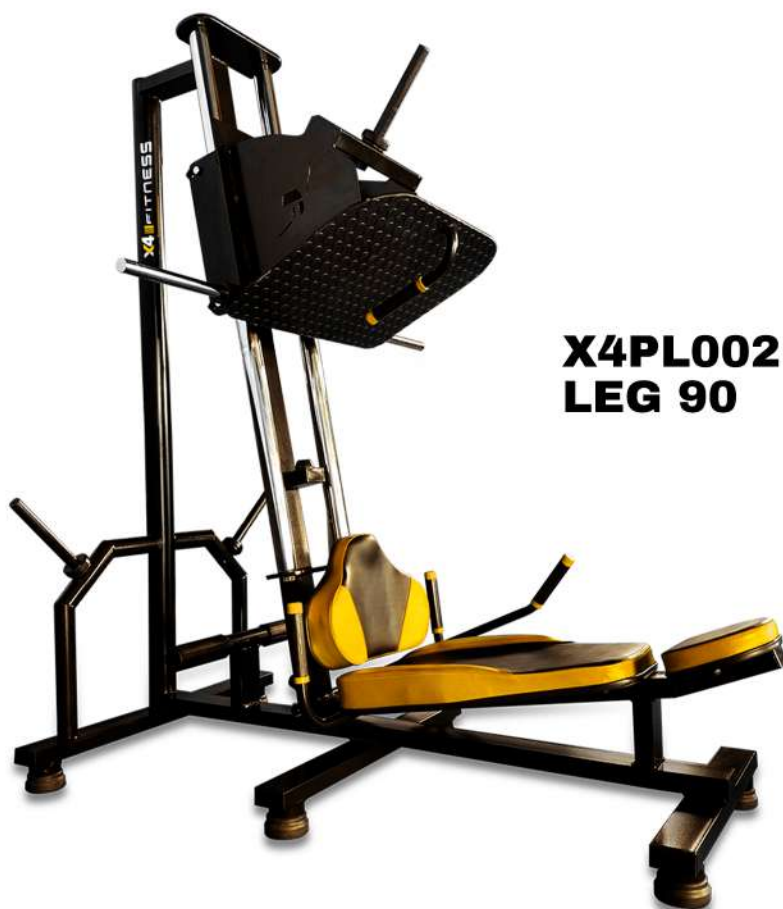
X4PL002 LEG 90