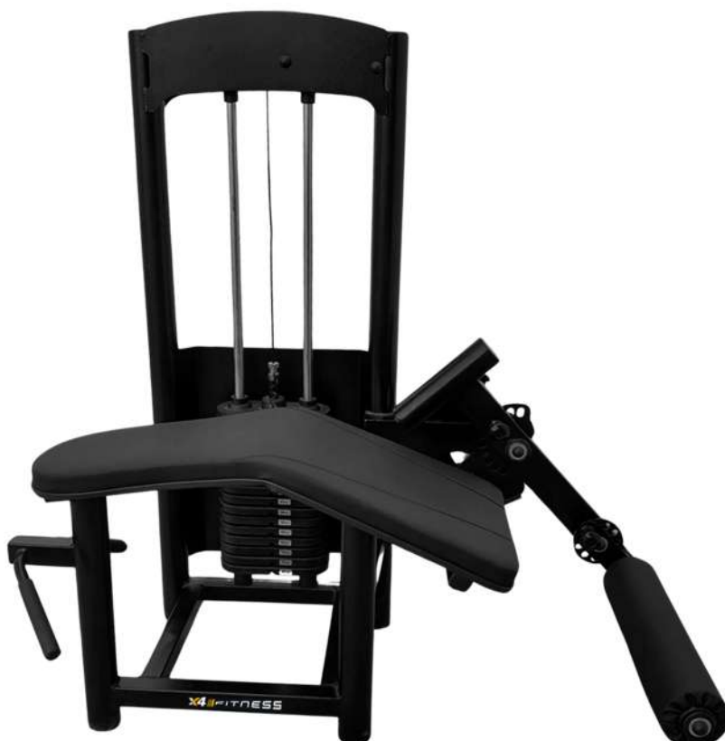
X4MQ010 MESA FLEXORA