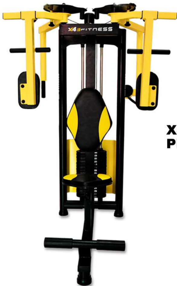
X4MQ022 PEITORAL DORSAL