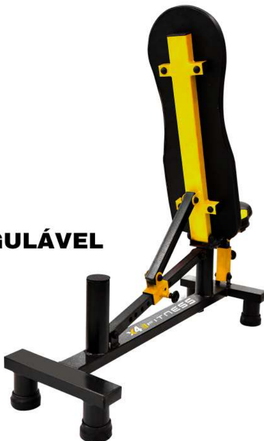
X4BC009 BANCO REGULÁVEL DE 0 À 90