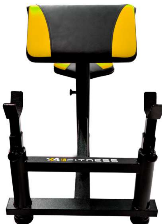
X4BC003 BANCO SCOTT