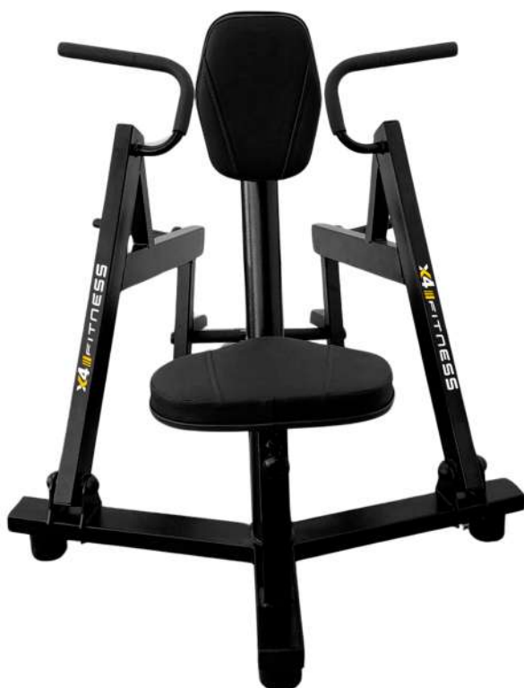
X4AT013 REMADA SENTADA ARTICULADA