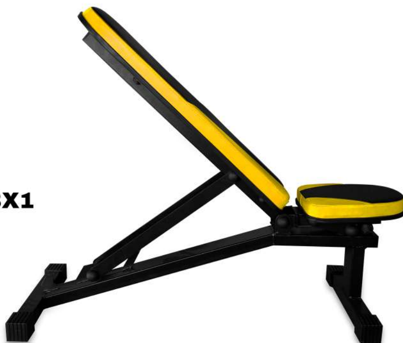
X4BC012 BANQUETA REGULÁVEL 3X1