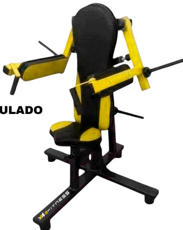
X4AT004 DELTOIDE ARTICULADO