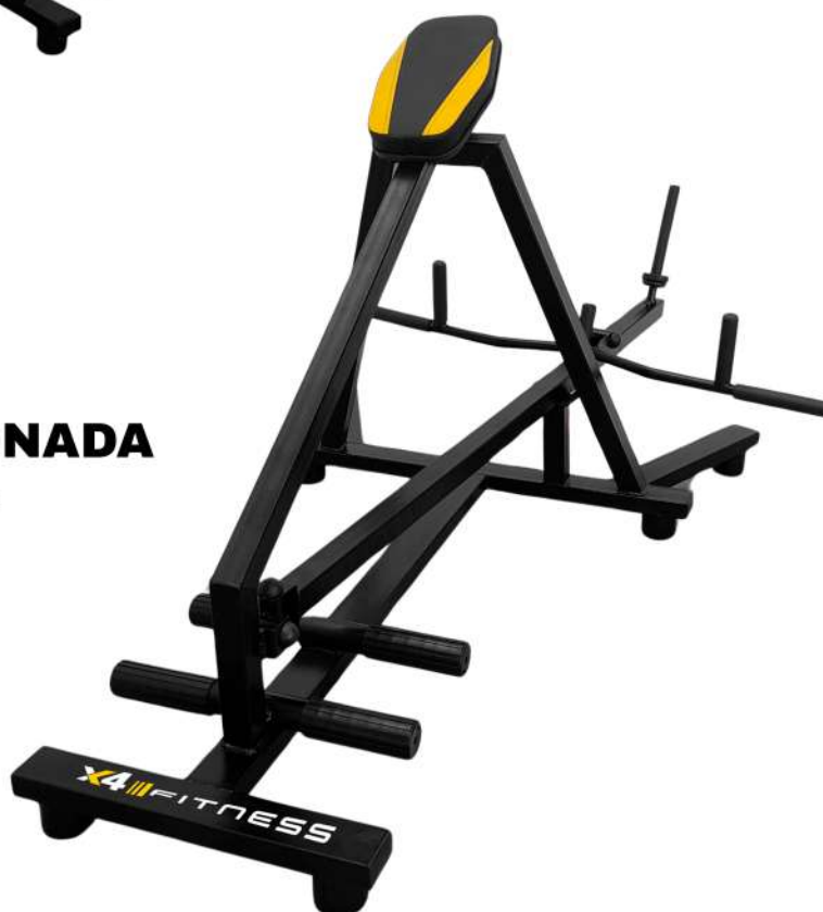
X4AT012 REMADA PRONADA ARTICULADA