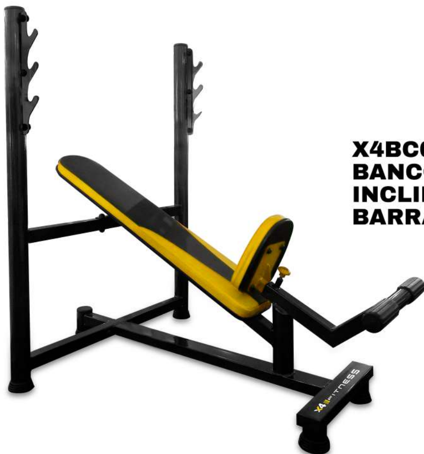
X4BC006 BANCO SUPINO INCLINADO PARA BARRA